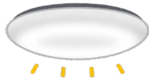
不要な照明は消す