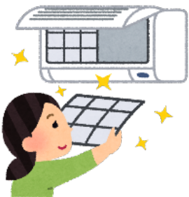
フィルターの掃除