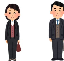
ウォームビズの推奨