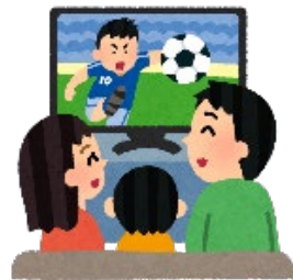
省エネモードにする