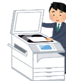
省エネモードにする