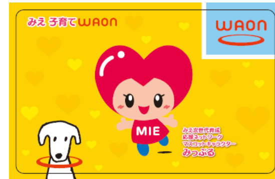
WAONカード (20,000円チャージ済)