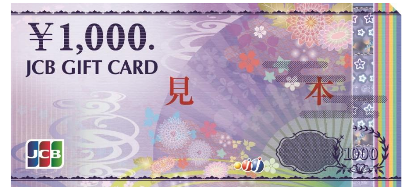
JCBギフトカード（1,000円×20枚）