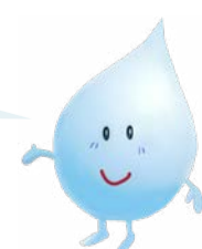
企業庁 マスコットキャラクター みずたまくん