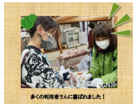
多くの利用者さんに喜ばれました！