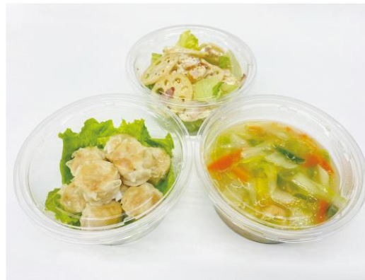
テイクアウト惣菜

販売した代金は ユニセフへ募金 しています。食品ロス、社員、社会の困っている人たち、みんなが笑顔になれる取り組みを考えています。