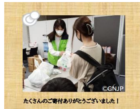
たくさんのご寄付ありがとうございました！

子供たちに我慢させていることも多く、お腹一杯食べれているのか心配になりますが、支援してくださる方がいるので、とても励みになります。