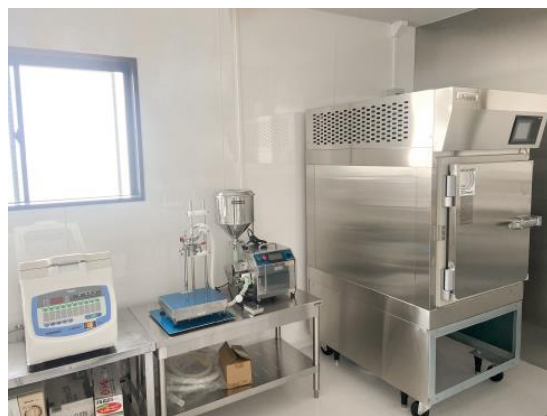
急速冷却 冷凍装置 3D Freezer®

レトルト釜、急速冷凍機を使い、賞味期限延長に適したレトルト食品、冷凍食品の試作が簡単に行えます。