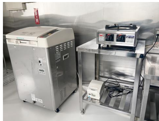
小型高温 高圧調理機