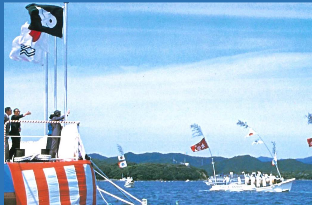
第4回全国豊かな海づくり大会（昭和59年、三重県） パレード船に手を振っておこたえになる当時の皇太子、 皇太子妃両殿下（現上皇、上皇后両陛下）