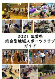
〔2021三重県総合型地域スポーツクラブガイド〕