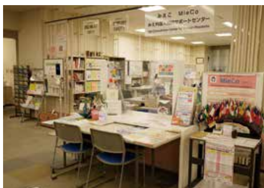
みえ外国人相談サポートセンター(MieCo)