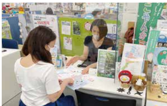
ええとこやんか三重 移住相談センター