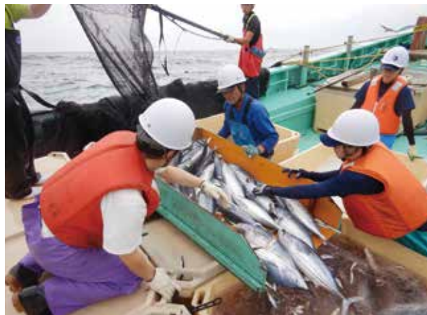
魚の水揚げ作業の研修