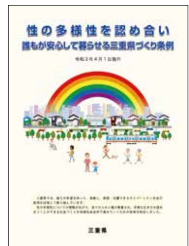
条例リーフレット