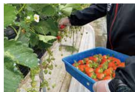
農作物の収穫作業の研修

県産の高級農畜産物等については、三重のブランドとして、販売チャネルの多様化を進めるなど、国内外への販売促進に取り組みます。また、県内中心に販売促進を図る農畜産物等は、“地物一番”商品として、スーパー等と連携しながら、県民の皆さんに浸透を図るとともに、直売所を核に地元農産物の生産・販売体制の充実に取り組むなど地産地消を推進します。さらに、小中学生はもとより、多様な世代に対し、食育に取り組むとともに、県産農畜産物等にまつわる食文化や歴史・文化の継承に取り組みます。