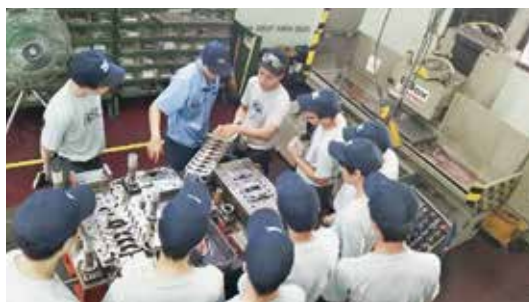
インターンシップの様子