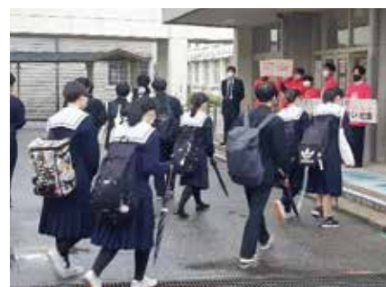
ピンクシャツ運動

教職員のいじめへの対応力を高めるため、具体的なケースに基づいて、いじめの構造やいじめの当事者となっている子どもたちへの対応やその留意点、いじめを生まない学級づくりなどについて学ぶ研修を実施します。各県立学校の校務にいじめ対策担当を位置づけるとともに、いじめ対策に知見を有するいじめ対策アドバイザーを県立学校に派遣して、学校で発生しているいじめの事例検討や、効果的な対応に向けた助言などの支援を行います。また、いじめや暴力行為への対応にあたる教職員への心理・福祉・法律の専門的な見地からの助言、子どもたちの不安やストレスを低減するための心の授業の実施など、専門人材を効果的に活用した支援体制の充実に取り組みます。暴力行為については、警察官経験者、教員経験者等からなる生徒指導特別指導員を各学校に派遣し、暴力行為の防止、被害者支援に取り組みます。