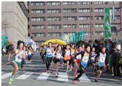
美し国三重市町対抗駅伝