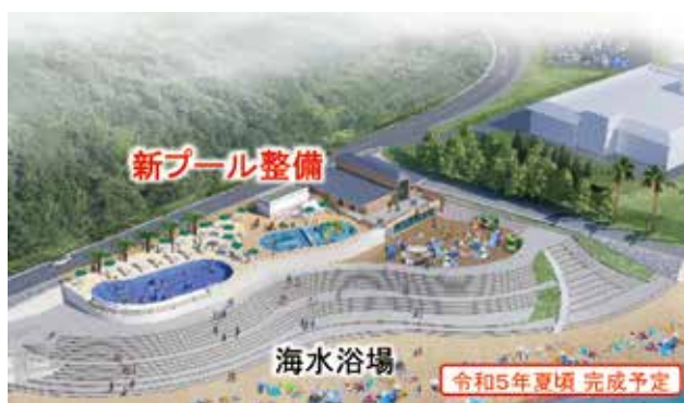
ワーケーション推進に必要な公園整備（熊野灘臨海公園）

新築建築物等の検査や既存建築物の維持保全の徹底により建築基準法の遵守を促すとともに、都市計画法に基づき適確な開発行為の許認可を行うことなどにより、安全・安心な建築物および宅地の確保に取り組みます。また、住宅・建築物の所有者への耐震化の働きかけや、耐震診断、補強設計、耐震改修、除却への補助を行うとともに、低コストの住宅耐震改修工法の普及を図ります。