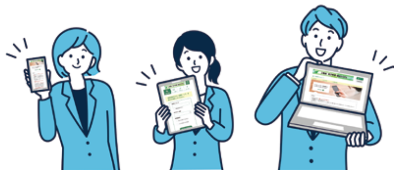
行政手続のデジタル化（イメージ）