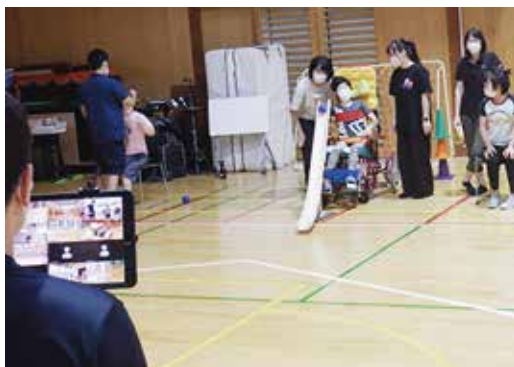
県立特別支援学校におけるボッチャ交流試合