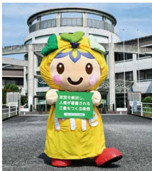
三重県人権センターとセンターのマスコットキャラクター「ミッコロ」