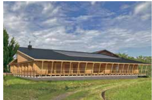
みえ森林・林業アカデミー新校舎（イメージ図）

森林や木づかいに関するさまざまなイベントの開催等を通じて、森林の現状や課題を県民の皆さんに認識していただくとともに、県民の皆さんが積極的に森林づくり活動に関わることができる環境整備を進めます。また、「みえ森林教育ビジョン」に基づき、森林教育の裾野の拡大や子どもから大人まで一貫した教育体系の構築に取り組み、森林づくりや木づかいを支える人材を育成します。