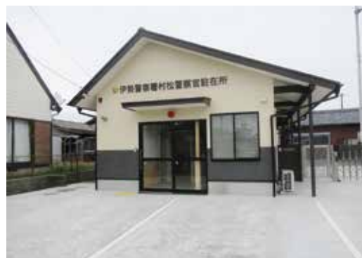
交番・駐在所の建替整備

少子高齢化が進む地域の実情や、社会の変化に適応するため、老朽化した警察施設の建て替えやパトカーの配備、装備資機材の充実など、警察活動を支える基盤の強化を行い、効果的な警察活動の推進を図ります。