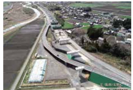
東海環状自動車道（北勢IC(仮称) - 大安IC）