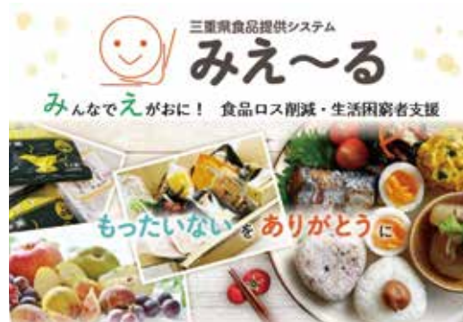
三重県食品提供システムみえ〜る