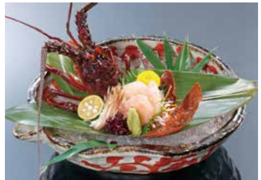
伊勢えびのお造り