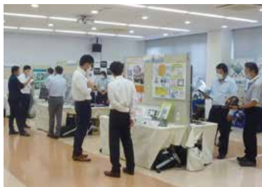
販路開拓に向けた技術展示商談会の開催