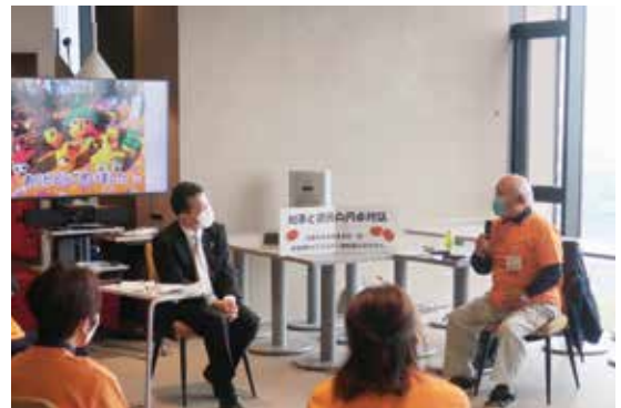
知事と県民との円卓対話