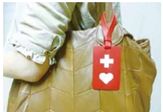
ヘルプマーク (援助や配慮を必要とする旨を、周囲に伝えるマーク)