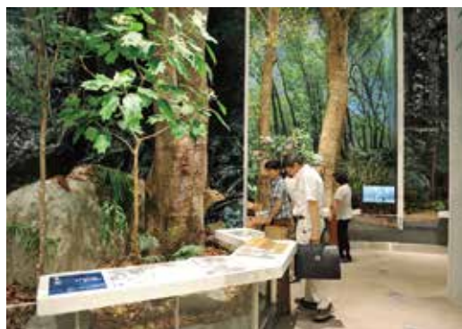
MieMu（三重県総合博物館）展示風景