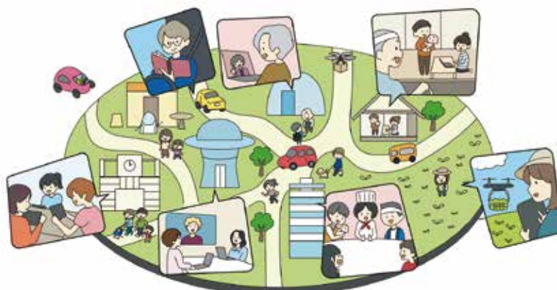
みえのデジタル社会のイメージ