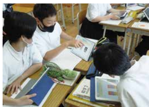
学習端末を活用した学び

「三重県立学校施設長寿命化計画」に基づき、計画的に老朽化対策やトイレの洋式化に取り組みます。また、空調設備の整備・更新や施設のバリアフリー化、地球温暖化対策のための省エネルギー化や木質化を推進し、安全・安心で快適な学校施設の整備を進めます。小中学校でも必要な整備が進められるよう、市町への情報共有や助言を行います。