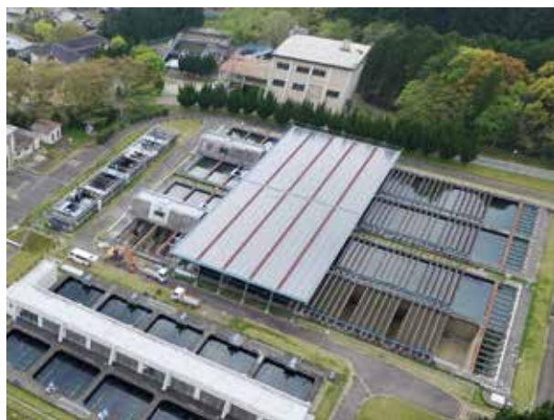
耐震補強中の高野浄水場