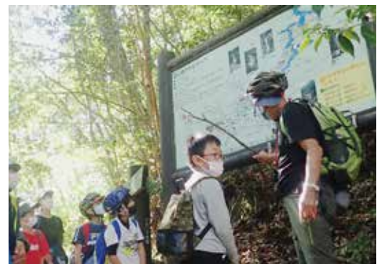
大杉谷でのエコツーリズムの様子

利用者が安全に自然公園を楽しむよう、老朽化や災害等で修繕が必要な公園施設の整備を計画的に進めます。また、多くの人々が自然環境保全への意識を高め、自然の魅力を体感いただけるよう、エコツーリズムの体験プログラムの多様化やガイドの育成、効果的な情報発信に取り組めます。