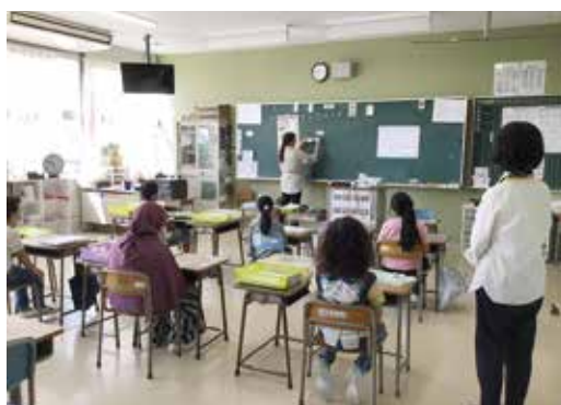
日本語指導教室の様子