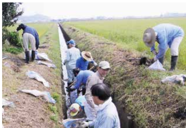
地域の農業者を中心とした水路の清掃活動