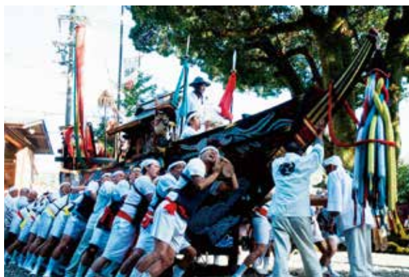
関係人口が参加した地域の祭り（紀北町の関船祭）