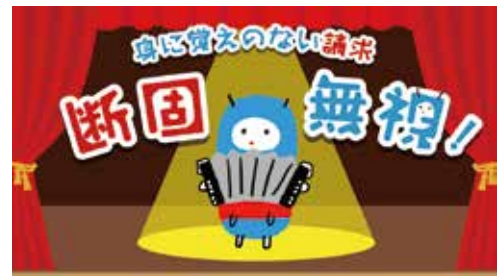
架空請求トラブル防止啓発キャラクター 「ダンコムシ」

消費者が正しい知識を得て、適切な消費行動を取ることができるよう、さまざまな主体と連携して、若年者や高齢者等の世代に応じた消費者教育・消費者啓発を実施します。成年年齢の引下げをふまえ、特に若年者については教育機関等と連携し、消費者教育を一層充実させていきます。また、高齢者等の消費者トラブルを防ぐため、地域における見守り体制の構築を支援します。さらに、持続可能な社会の形成に寄与するため、人や社会、環境に配慮した消費行動であるエシカル消費の普及・啓発、コロナ禍における生活様式に対応した消費行動の推奨に取り組みます。