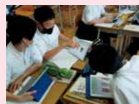
Klase na gumagamit ng ICT (information and communication technology)