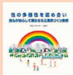
Ordinansa sa pagpapaunlad ng Mie Prefecture na nagbibigay-daan upang mamuhay nang ligtas at matiwasay ang sinuman sa pamamagitan ng pagkilala sa diversity o pagkakaiba ng kasarian