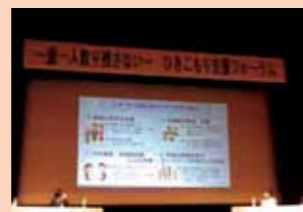
Hikikomori (pag-iwas sa lipunan) support forum