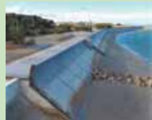
Mga hakbang laban sa tsunami at bagyo sa pamamagitan ng pagpapatibay sa mga pilapil, at iba pa