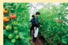
Pagsasanay sa trabaho sa kolehiyong pang-agrikultura