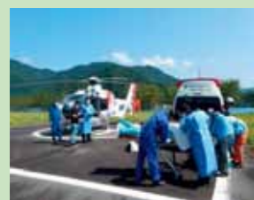
Pagsuporta sa operasyon ng medical helicopters para sa emerhensiya