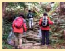
Pagbuo ng isang conservation system para sa Kumano Kodo Iseji Route