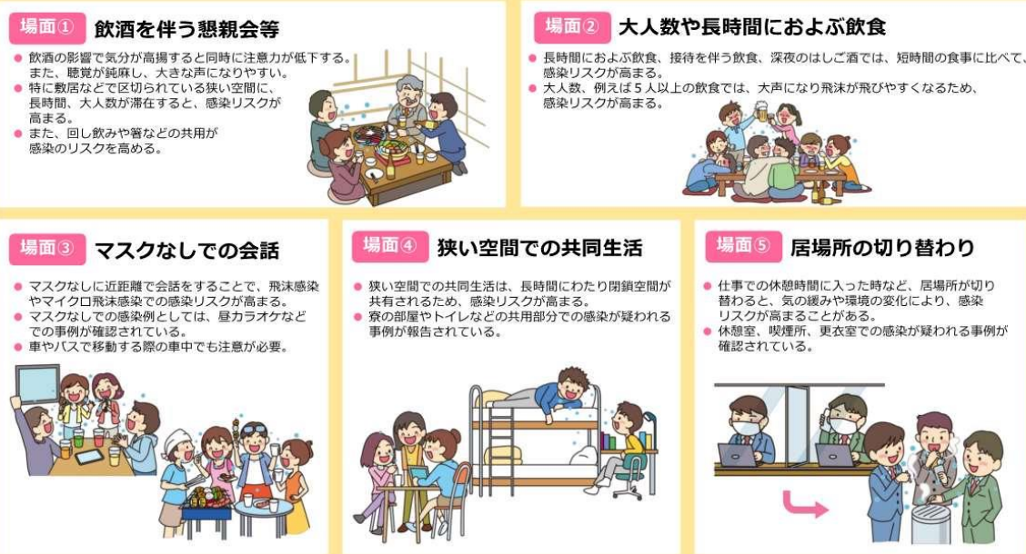
図2 感染リスクが高まる「5つの場面」（内閣官房のウェブサイトより一部抜粋）