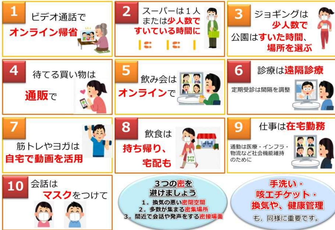
図1 人との接触を8割減らす、10のポイント（厚生労働省のウェブサイトより一部抜粋）

緊急事態宣言の中、誰もが感染するリスク、誰でも感染させるリスクがあります。 新型コロナウイルス感染症から、あなたと身近な人の命を守るよう、日常生活を見直してみましょう。