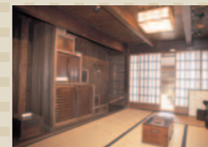
関まちなみ資料館