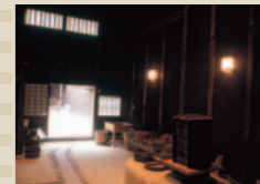
関宿旅籠玉屋歴史資料館