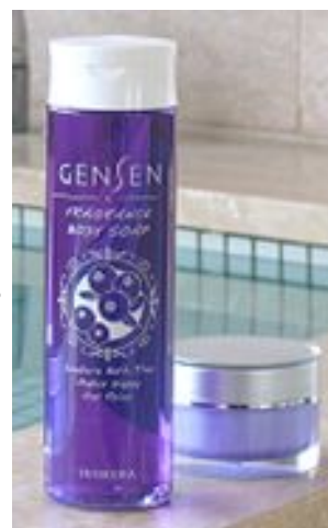
ボディソープ・スキンケアクリーム ブルーベリーポット栽培

いのさん農園は、鈴鹿高専と共同研究した液体肥料を、自ら考案した比率により配合し、ブルーベリーの安定生産を図る。フタバ化学は、初めての試みとなる植物から抽出したエキスと「猪の倉温泉」のアルカリ温泉水をブレンドしてボディソープ等のスキンケア商品を製造する。猪の倉は、Gensenシリーズとして都市型雑貨店等で販売し、新ブランド構築を通じて、若年女性層を中心に新規顧客の獲得を目指す。