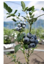
ブルーベリーブライトウェル種