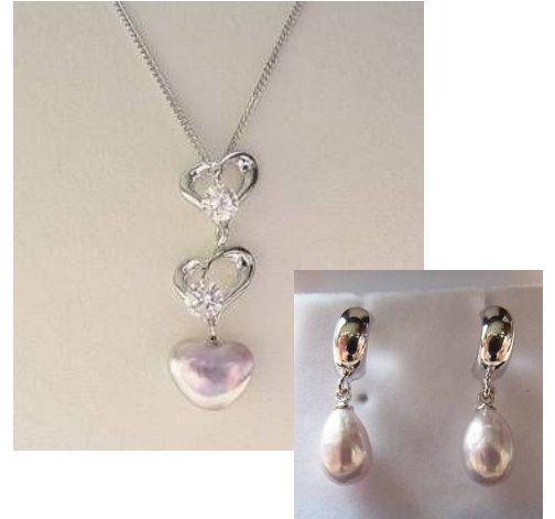
左:ハート型 右:涙型

OKKO真珠(株)は、長期的な不景気による宝飾品の買い控えや若年層の真珠離れ等による真珠業界全体の需要低迷により新たな真珠商品の開発が必要だと感じていた。バイヤーや消費者への入念なヒアリングを行い、市場ニーズを捉えた商品企画、出荷数量にかかる養殖計画を策定した。一方の養殖業者は、独自のノウハウを活かし難易度の高いセラミックス核の挿入による真珠養殖を実現。また、核自体に着色されたセラミックス核を用いることで、真珠の色落ちを防止した。こうして、従来の真珠イメージから脱却し、今までの真珠にはないカラーやデザイン性の組み合わせを有する商品化に至った。