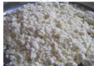
にがり農法で栽培された大豆パウダー

本事業では深層水から抽出した「高ミネラルにがり」を使い、農薬や化学肥料の使用を低減させた「にがり農法」を導入した大豆、米の栽培を行うとともに、消費者に栽培に関する情報を開示できる仕組みを確立。ミナミ産業の超微細化技術などで大豆パウダー・米粉パウダーに加工するとともに、それらを使った加工食品の新商品を開発、市場展開を図る。