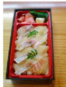
タイ昆布じめ寿司

本事業の商品は、天然の好漁場を活かし、適正給餌や環境配慮型養殖から生まれる「マダイ」「ブリ」を活用、昆布じめ寿司(マダイ)、漬け寿司(ブリ)の事業展開を図る。魚を「しめ」の際に、酢を使用しないことから酢独特の臭いや変色の無い昆布じめを実現した。さらに、消費者のニーズに対応して消費期限を伸ばすことにより利便性向上を目指すとともに、冷凍寿司や魚の加工食品などの開発を進める。