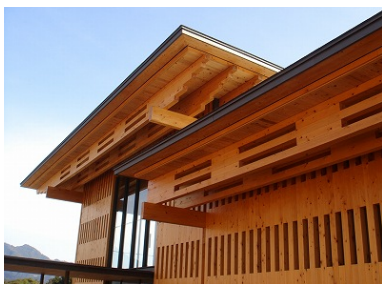
熊野古道センター