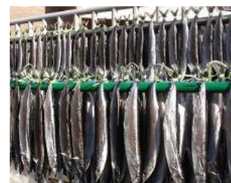
サンマのすだれ干し