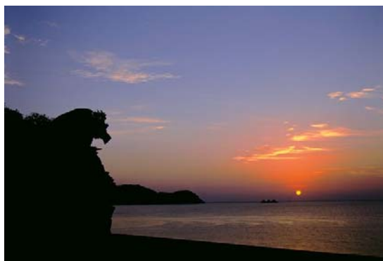
獅子岩と朝陽（国道42号沿い）

※東紀州地域活性化事業推進協議会は、4月1日より東紀州観光まちづくり公社に名称変更する