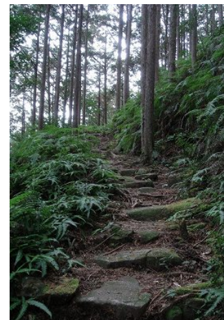
熊野古道（三木峠口）