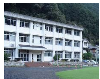
廃校の学校活用(島勝浦)