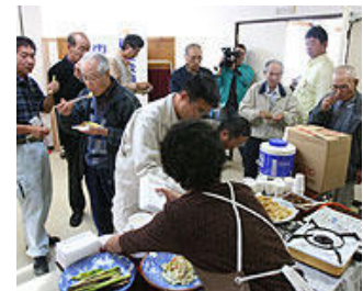
マコモの試食イベント