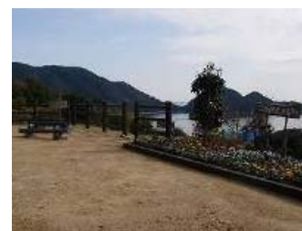
ビューポイント整備事例