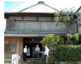
旧旅籠へのギャラリー設置