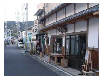
まち並み景観への配慮