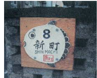
まちの案内サイン