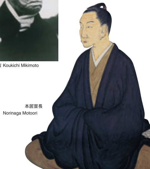
本居宣長 Norinaga Motoori

三重県の農林水産物といえば、伊勢茶、三重さつき、松阪牛、伊賀牛、尾鷲ヒノキ、真珠、伊勢エビ、的矢カキなどが有名です。これらは温暖な気候とともに、1,000kmを超える海岸線と県土の65%を占める森林、伊勢湾沿岸に広がる平野という変化に富んだ自然条件から生み出されたものです。また、工業面では、自動車、造船などの輸送機械製造業や石油精製などの重化学工業が発達しています。このほか近年付加価値の高い半導体や液晶などの先端産業が立地しています。