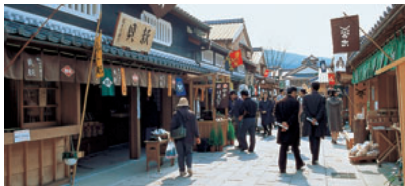
伊勢市 / おかげ横丁 Ciudad de Ise / Calle Okage