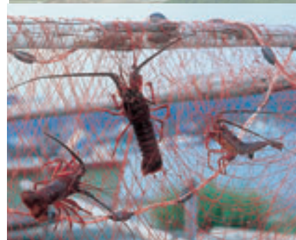
伊勢エビ Langostas de Ise