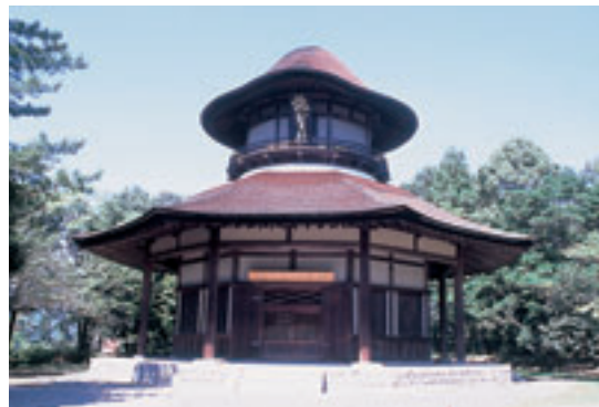
伊賀市 / 俳聖殿 Ciudad de Iga / Haiseiden - (Santuario de la Poesía)

ciudades al servicio de castillos tales como Oominato, Kuwana, Anotsu y otras. La industria prosperó gracias al algodón de Matsusaka y Ise-katagami (patrón de papel). Además, se produjo un intenso florecimiento cultural y educativo con la llegada de catedráticos y literatos. Asimismo, la peregrinación popular al Santuario de Ise se convirtió en la manera de pensar que más predominó en esa época. Cabe destacar que Mie es la cuna de personajes de talla histórica como el poeta Basho Matsuo, quien nos legó sus crónicas de viaje y sus poemas en obras tales como "Oku no hosomichi" (El sendero de Oku) y muchos otros más, o bien, Takatoshi Mitsui, fundador del conglomerado empresarial Mitsui; Zuiken Kawamura, gran estadista de principios de la era Edo; Norinaga Motoori, un prestigioso catedrático; Takeshiro Matsuura, el explorador que bautizó a Hokkaido; Yakodayu Daikoku, quien aterrizó en Rusia después de una serie de dificultades en vuelo; Yukio Ozaki, a quien se considera como el creador del gobierno constitucional; Kokichi Mikimoto, quien consiguió un éxito rotundo en el cultivo de la perla; Ranpo Edogawa, el famoso autor de novelas de suspense, así como una interminable lista de hombres insigues.