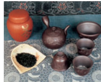
四日市萬古焼 Cerámica Banko de la Ciudad de Yokkaichi