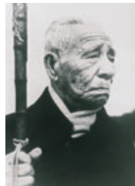
御木本幸吉 Koukichi Mikimoto