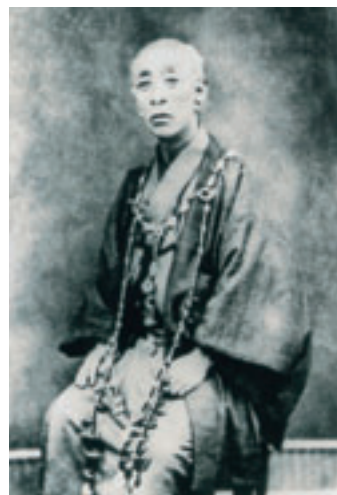
松浦武四郎 Takeshiro Matsuura