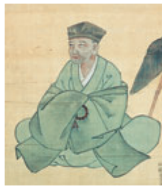
松尾芭蕉 Basho Matsuo