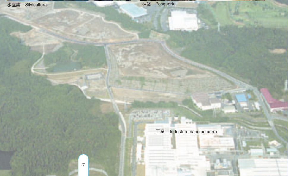
工業 Industria manufacturera