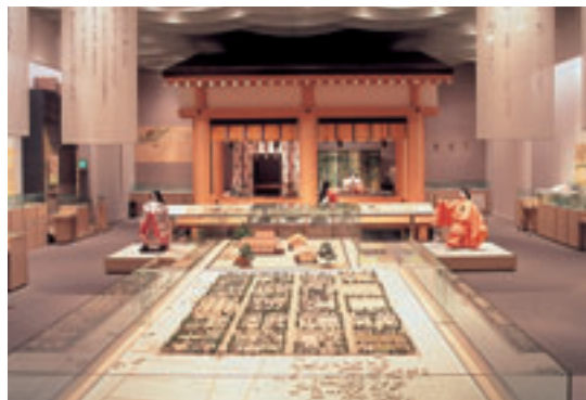
明和町 / 齋宮歴史博物館 Distrito de Meiwa / Museo Histórico de Saiku