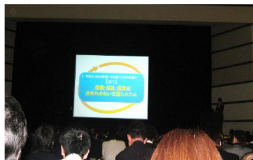
厚生労働省 講堂（平成26年2月24日）

三重県あすなる学園の報告は、「個別の指導計画を保育から始め、教育に引き継ぐための仕掛け（ツールと人材育成方法）」と題し、「CLMと個別の指導計画」の要点である教育に引き継ぐための仕掛けと、保育所・幼稚園の先生方の専門性の向上につながる仕掛けを全国に発信しました。報告会后1週間も経たないうちに、県外から視察の問い合わせがきています。