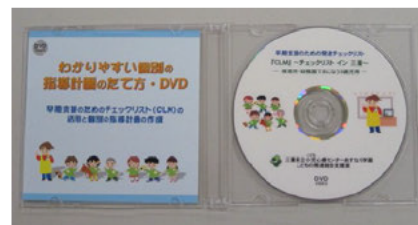
個別の指導計画の立て方DVD