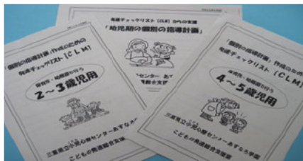
発達チェックリスト・個別の指導計画