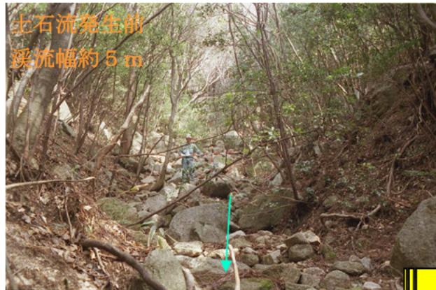
土石流発生前 溪流幅約5m