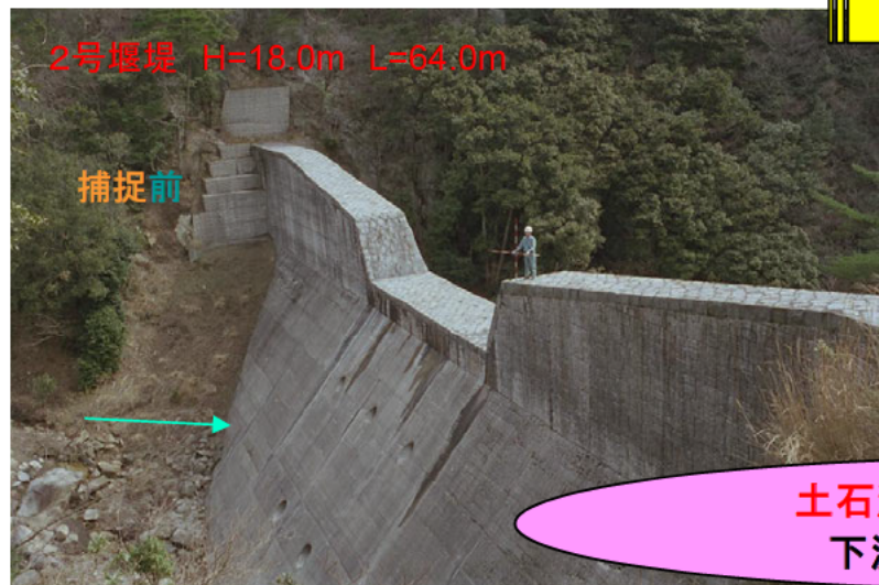
2号堰堤 H=18.0m L=64.0m