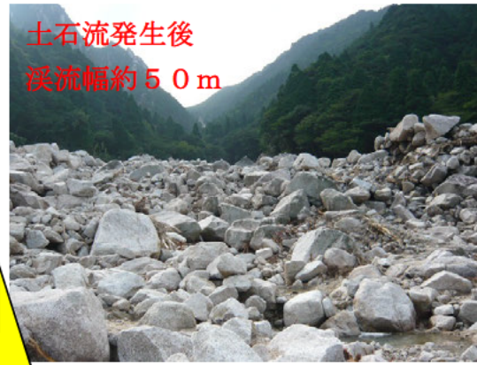
土石流発生後 溪流幅約50m