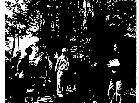
H24 緑地等適正管理事業 桑名市多度町