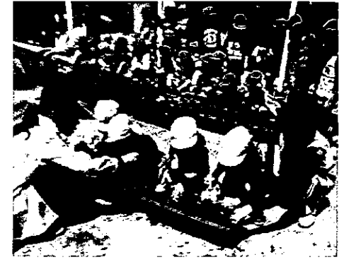
H25 春期緑化運動 伊勢市立保育所ゆりかご園