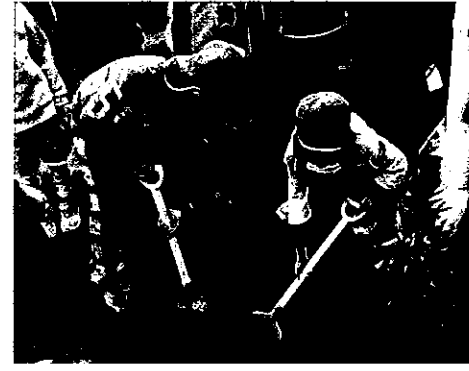
H25 春期緑化運動 津市立榊原幼稚園