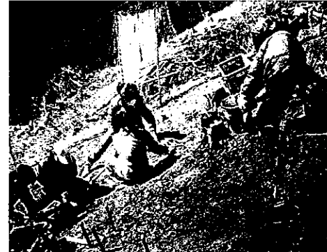
H24 緑の募金交付事業 大台町 宮川林業研究会