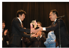
H23グランプリ表彰 (豊学校小学部)