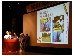
H23「企業庁人材育成部会」の発表