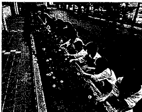
H24 春期緑化運動 大台町立大台中学校