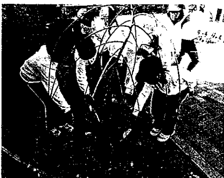
H23 緑の募金交付事業 津市立川合小学校