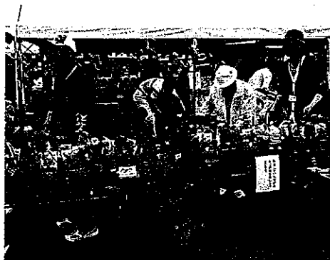
H24 春期緑化運動 明和町 緑のまちづくり推進委員会

※その他は、繰越金で翌年度に緑の募金が入金されるまでの期間、春期緑化運動経費等に使用します。