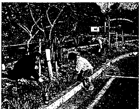
H23 緑の募金交付事業 志摩いそぶえ会