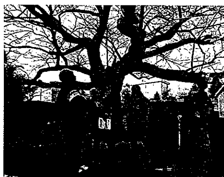
H23 樹木健康診断 四日市市小山田地区市民センター ソメイヨシノ