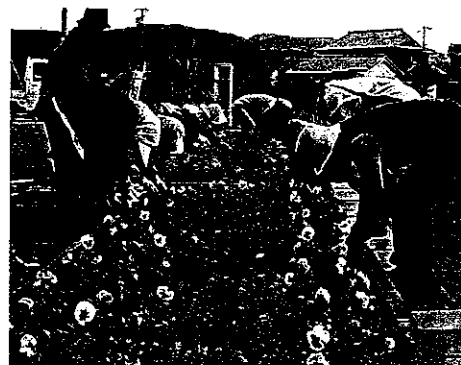
H23 緑の募金交付事業 伊勢市粟野区