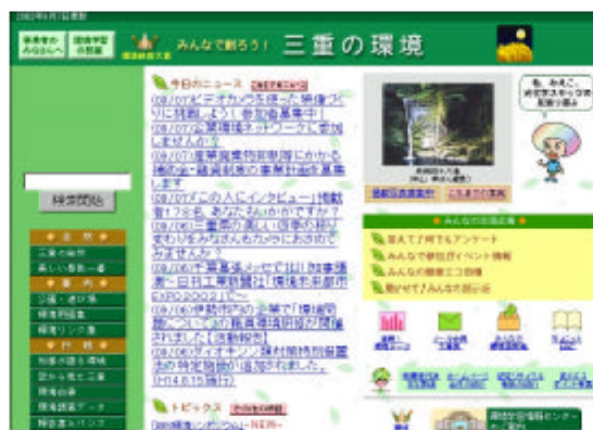
HP「三重の環境」トップページ

協働・連携の実現には情報公開・情報発信が最重要であるとの考えのもと、三重県の環境が何でもわかるホームページ「三重の環境」 http://www.eco.pref.mie.jp を毎日更新し、年間 312 万ページビュー（平成 13 年度実績）のアクセスがありました。