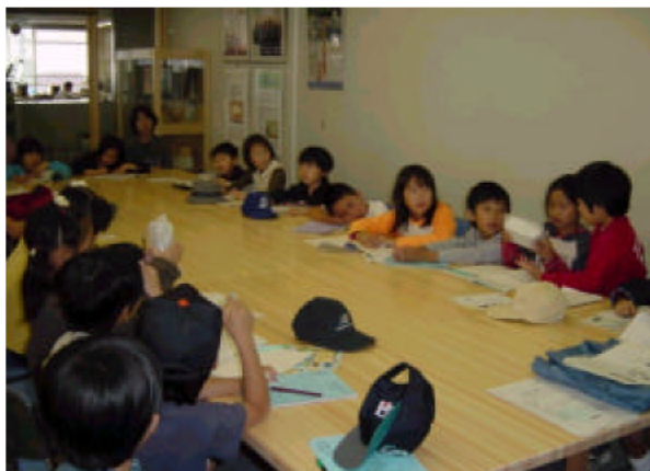
「創造の森」で学習する小学生

環境部内に、県産の木材等を使用したプレゼンテーションルーム「三重の環境 創造の森」を配置し、県庁訪問者とのコミュニケーションの場としています。小学校の社会見学のコースとして、職員が三重県の環境施策や県庁の環境取組について説明したり、企業や学識経験者等と職員との情報交換の場として活用するなど、県民の皆様とのコミュニケーションの場として積極的に活用しています。