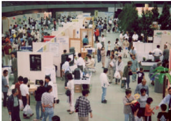
環境フェア2001 来場者数：63,000人 出展団体：240団体

県民、企業、関係団体、環境NPOなどが参加し、21世紀における循環型社会の形成に向けて、地球環境の保全から身近な環境問題まで、様々な環境取組を発信するとともに情報共有する場として、平成13年5月26日（土）～27日（日）、伊勢市の「三重県営サンアリーナ」において「MIE・みんなで創る環境フェア2001」を開催しました。