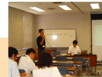
環境推進員研修 (H17年8月・津市)