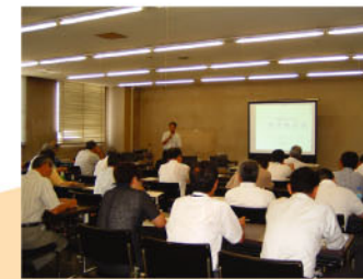
管理者研修 (H17年8月・四日市市)