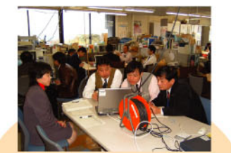
内部環境監査(教育委員会事務局)

推奨事項については、その取組内容を他部局へ紹介し、その活動を広げていくようにしています。