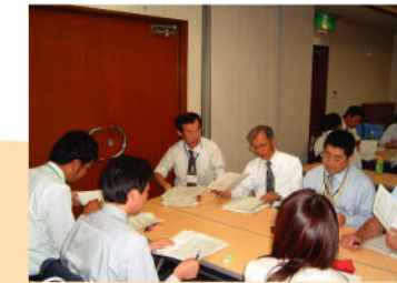
環境監査員研修 (H17年10月・津市)