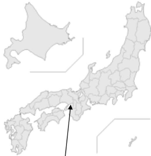
田尻スカイブリッジ