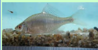
タイリクバラタナゴ