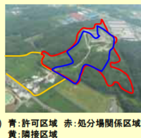
青：許可区域 赤：処分場関係区域 黄：隣接区域

直ちに人体への影響など生活環境保全上の重大な支障のおそれはないが、水質調査、廃棄物の回収、及び覆土・雨水排水対策が必要