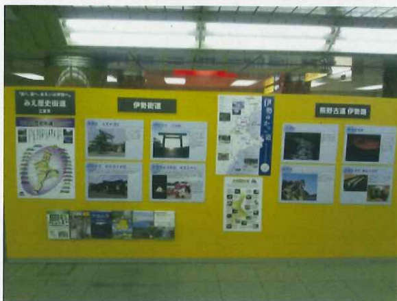
10/3～12/1日本橋「日本百街道」展