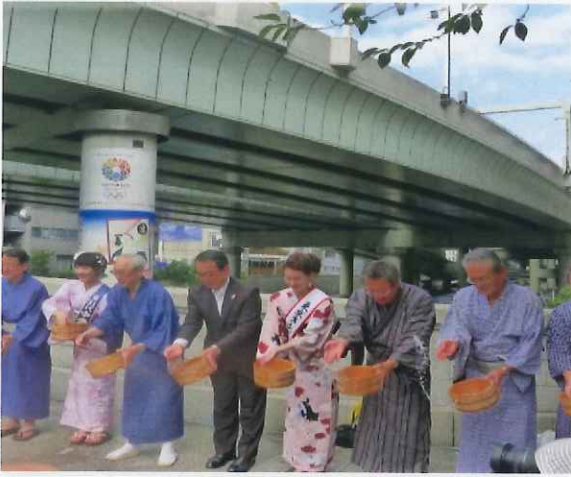
8/4 日本橋・橋の日打ち水大作戦