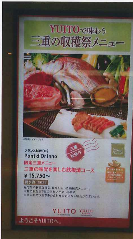
9/16~10/19 YUITOでの三重県フェア