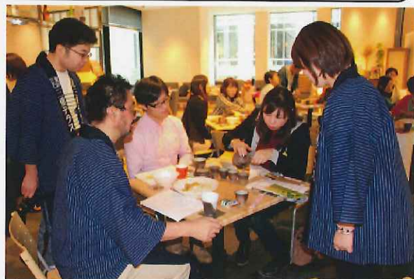
三重を走って、飲んで、食べて知る会