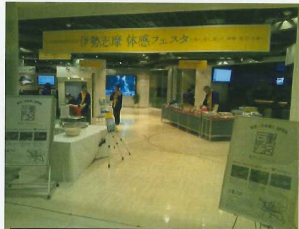
11/21~24 KITTEでの伊勢志摩体感フェスタ