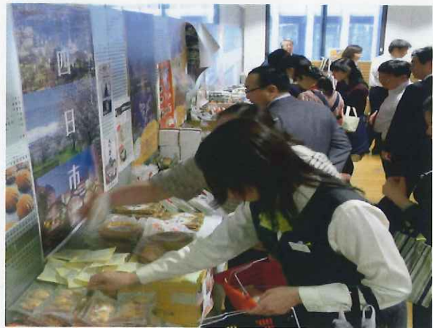
応援企業の社内購買での物産展