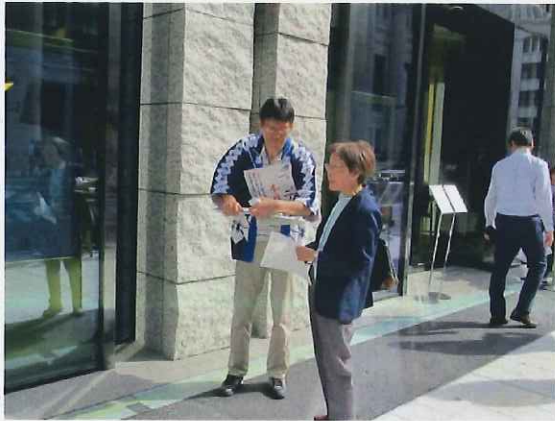
路面での呼び込み

路面での呼び込みで集客するとともに、12月17日のつディでは1階ショップで販売する津市の物産を2階で展示、試食することにより、1階との連携を図りながら津市のPRを行いました。