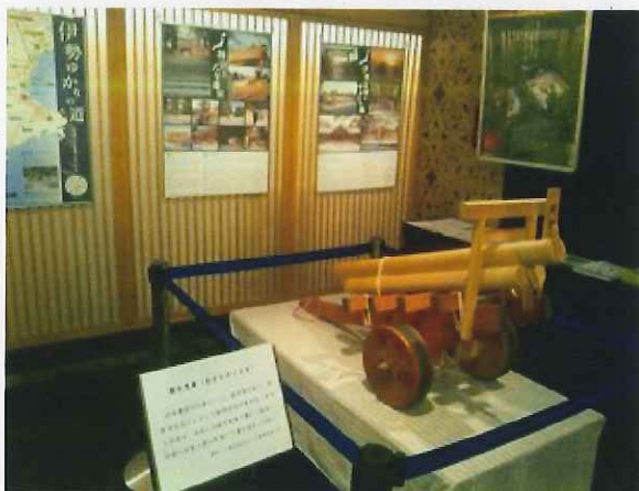
9/19～10/1 島根・奈良との三県連携パネル展示