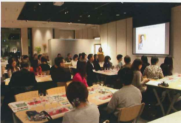
実演を交えながらの講座