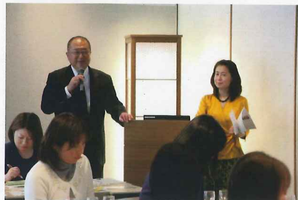
蔵元からも日本酒を紹介