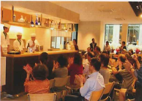
相可高校生による出汁の取り方実演