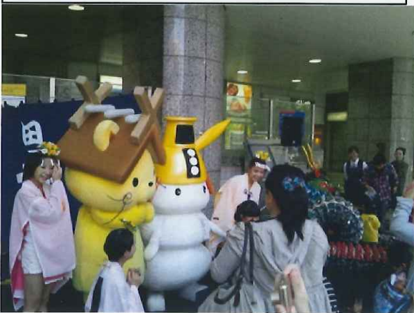
10/10~16 京急百貨店での島根県連携観光物産