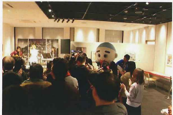
観光大使によるスペシャルライブ