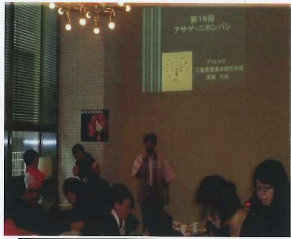
8/23 アサゲニホンバシでのPR