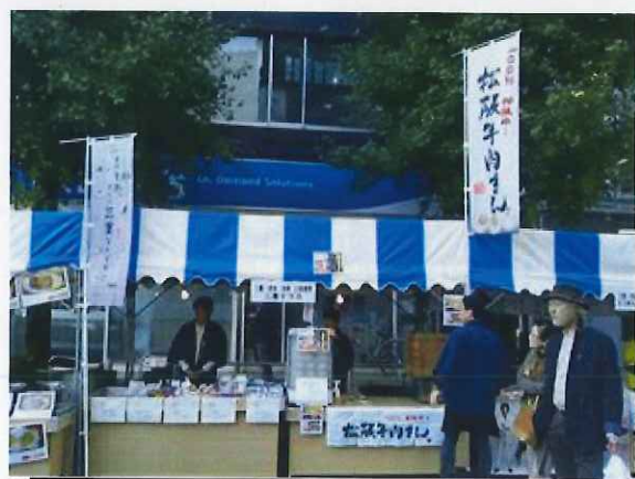
10/27 日本橋・京橋まつりへの出展