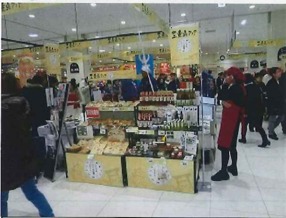
2/20~23 イオンモール幕張新都心での三重県フェア