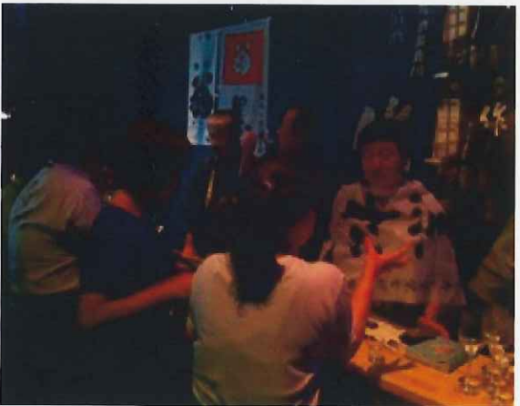
9/3、10、17 アートアクアリウムでの三重ナイト