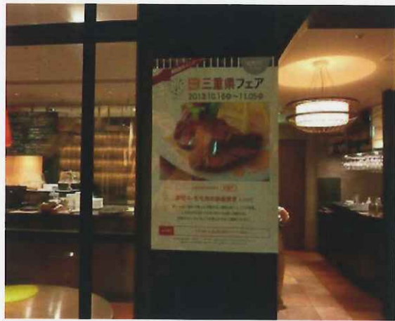
10/16~11/5 COREDO室町での三重県フェア