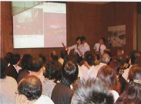
10/11 アサゲ46ドウフケン