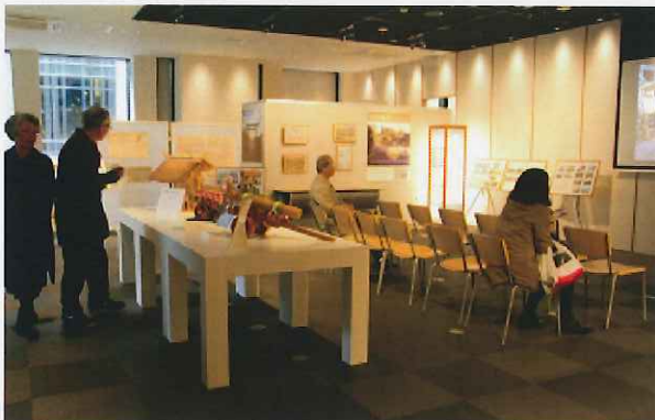
展示、ビデオの上映

日本橋で開催される「諸国往来市」(日本橋・京橋まつり実行委員会主催)のプレイベントとして、伊勢の今昔パネル展示やビデオの上映等を実施しました。