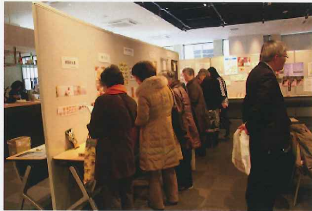
2階での展示・試食

○伊勢の今昔展(10月24~26日) 主催:伊勢市、伊勢市観光協会 参加者270人