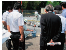
産業廃棄物不適正処理事案(桑名市五反田)

雇用対策、新県立博物館の整備、産業廃棄物対策、県産材の利用促進などの課題について調査し、委員からさまざまな意見や提案がありました。