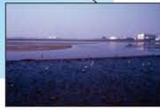
▲藤前干潟 (名古屋市)