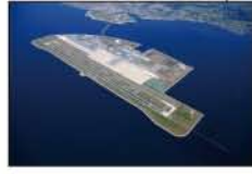
▲セントレア (常滑市)