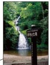
▲阿寺の七滝 (新城市)