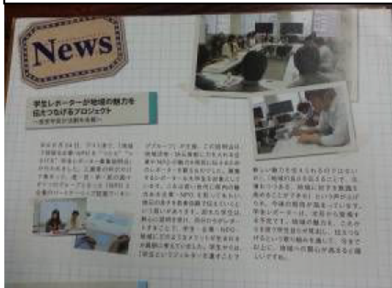
※JT と NPO 法人 Mブリッジが連携して発行する「ミエシカル」にも記事を掲載しました。