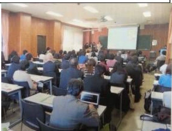
※三重大学人文学部 30 周年記念イベントで活動の報告会を開催しました。