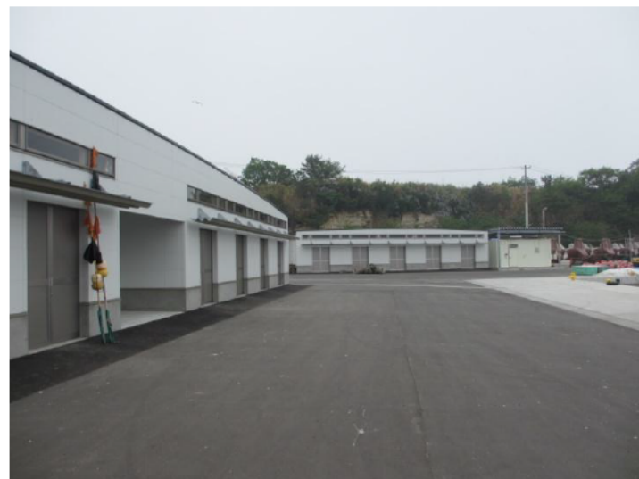
漁具倉庫(七ヶ浜地区、完成H25年4月)