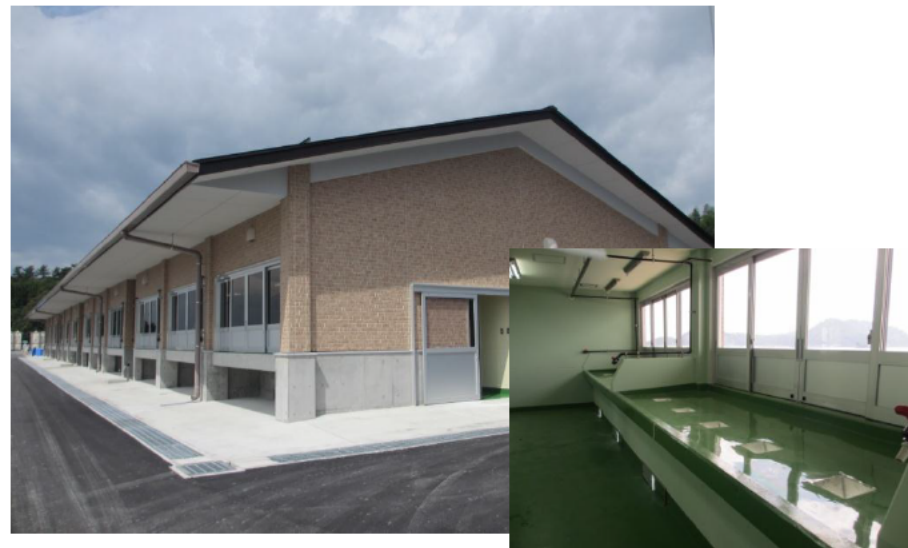
力キ処理場(鳴瀬地区、完成H25年9月)