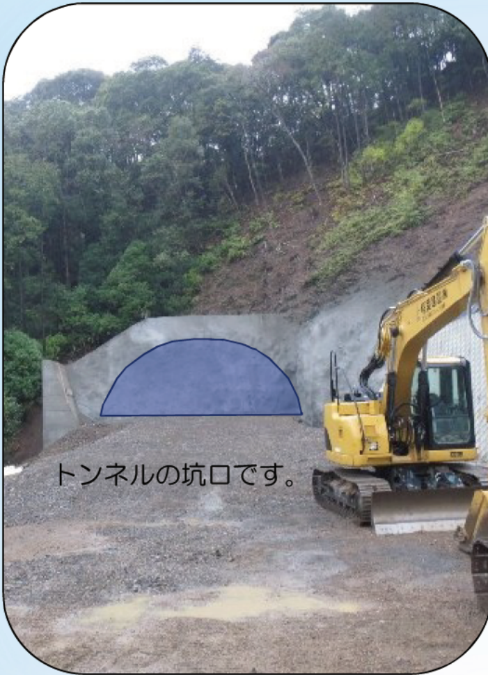
トンネルの坑口です。