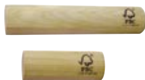
ひのきペーパーウェイト