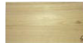
ひのきカッティングボード（まな板）