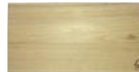
ひのきカッティングボード（まな板）