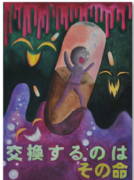
薬物乱用防止ポスター 最優秀作品