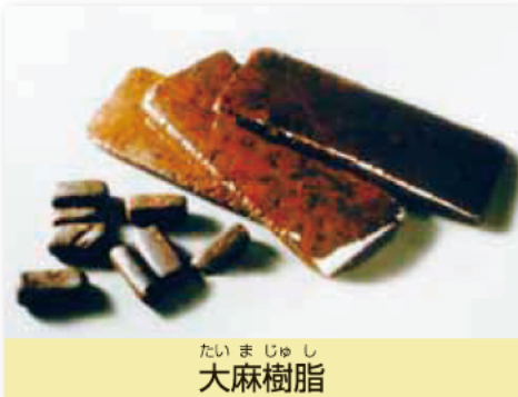
たい ま じゆし 大麻樹脂

「大麻に害がない」というのは全くの誤解です。 アルコールやたばこと比べて、人体への有害性は低いとい うことはありません。WHO (世界保健機関) の報告によ ると、記憶への影響、学習能力の悪化、知覚の変化、人 かくそうしつ ひ お しよ しょう い ぞんせい のこ 格喪失などを引き起こすほか、使用をやめても依存性が残 るなどとされています。