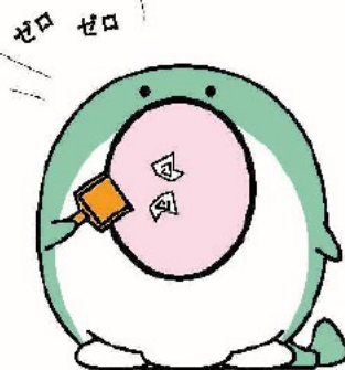
ごみゼロキャラクター「ゼロ吉」

家庭から出るごみの減量やリサイクルの取組を通じて、持続可能な循環型社会の構築について、考えてみませんか。