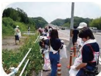
ごみゼロウォーク