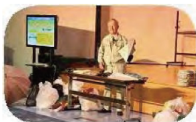
ごみゼロじいさんの講演

「展示・体験コーナー」では、環境活動団体・こどもエコクラブ・市町等の活動紹介を展示、ごみゼロクイズ、ゼロ吉ぬりえ、ペットボトル工作、風呂敷活用展示などで楽しんでいただきました。