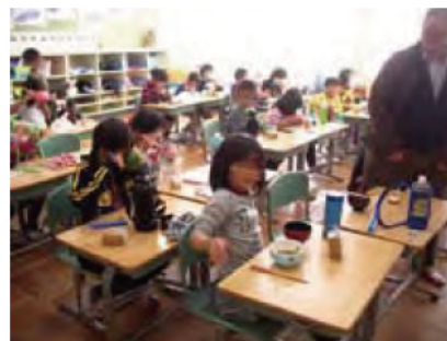
マイ箸、マイ椀で食事