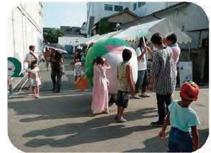
ブース前のゼロ吉