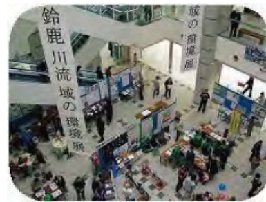
鈴鹿川流域の環境展