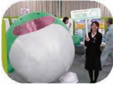
ゼロ吉がお出迎え