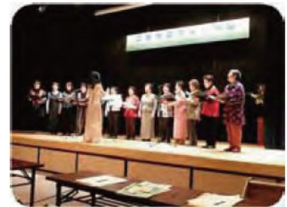
嬉野コールジョイの合唱