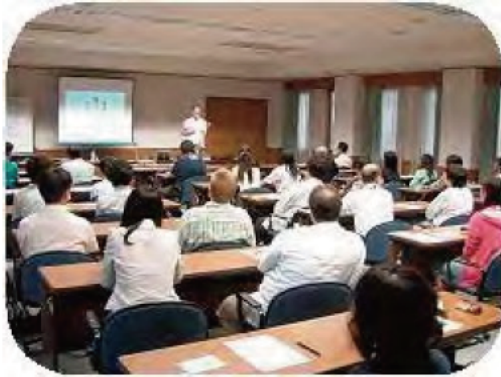
国際しゃべり場&セミナー