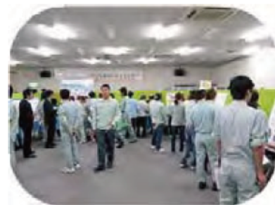
パネルに見入る従業員

また、「ごみ分別クイズ」、「水の汚れ度チェック」を楽しく体験でき、最後に従業員から応募のあった「エコ川柳」の秀逸作品への投票を行うなど盛りだくさんの内容となっています。