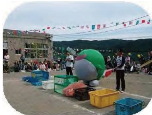
運動会で活躍するゼロ吉