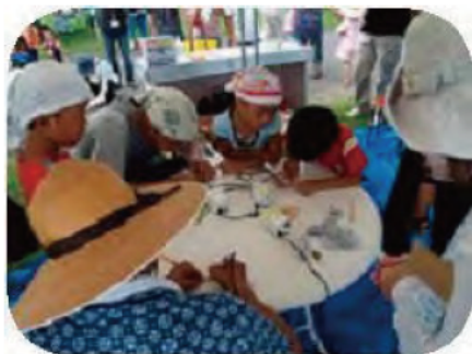
マイ箸づくり体験

NPO法人市民ネットワークすずかのぶどうが事務局となり開催する「夏の鈴鹿川体験イベント」の実行委員会に参加し、イベント全体に「ごみゼロの視点」が活かされるよう、マイ箸やマイ椀、マイカップの持参、リユース食器の使用、不要物の有効利用、イベント全体のごみ減量などの取組を行いました。