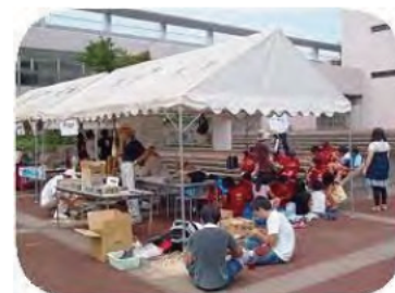
環境 体験・交流コーナー