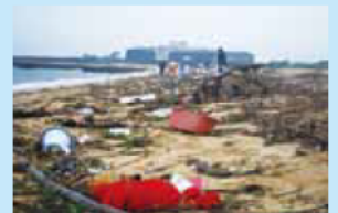
吉崎海岸(三重県四日市市)