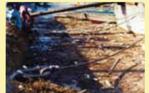
桃取港(三重県鳥羽市)