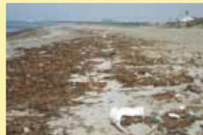
伊良湖海岸 (愛知県田原市)

海岸の景観悪化だけでなく海水浴場では利用面での支障が生じています。また、漁港などでは、多量の漂流ごみが流れ込むことで出港できないなどの影響があります。