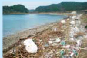
答志島・奈佐の浜海岸 (三重県鳥羽市)

流木などの自然ごみに混じって、生活ごみが多量に漂着し、美しい海岸の景観を損ねています。また、海浜動植物の生育等への影響も心配されています。