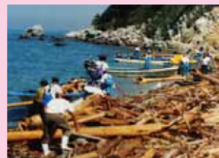
地域住民による清掃