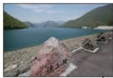
▲徳山ダム (揖斐川町)

伊勢湾やその流域の川・森に出かけて、自然に親しみ、生き物たちに興味を持ちましょう。