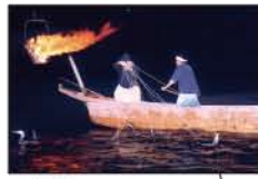
▲鶺鴒 (関市・岐阜市・犬山市)