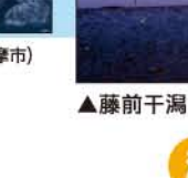
▲藤前干潟 (名古屋市)