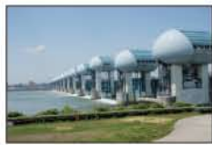
▲長良川河口堰 (桑名市)