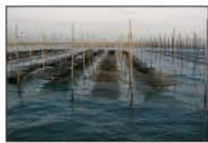
▲のりの養殖 (のりそだ)