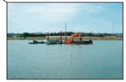
▲油ヶ淵 (安城市・碧南市)