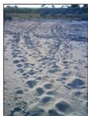
▲ウミガメ産卵上陸跡