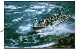
▲日本ライン下り (美濃加茂市・犬山市)