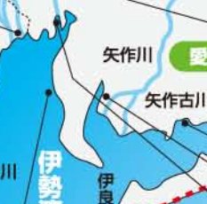
▲油ヶ淵 (安城市・碧南市)