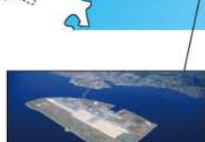
▲セントレア (常滑市)