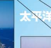
▲藤前干潟 (名古屋市)