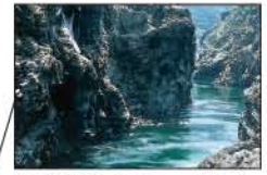
▲飛水峡 (白川町・七宗町)