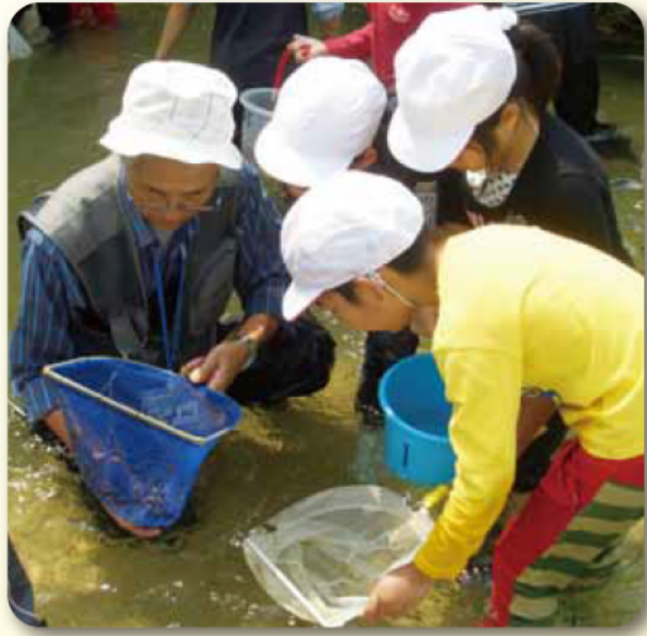
四日市市立下野小学校