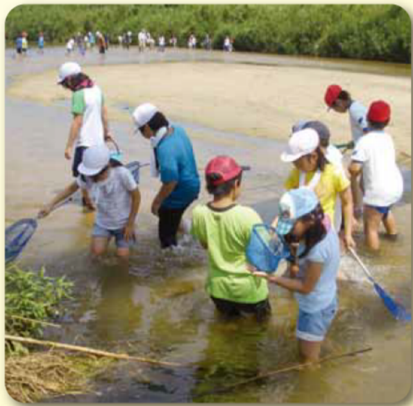
四日市市立八郷小学校