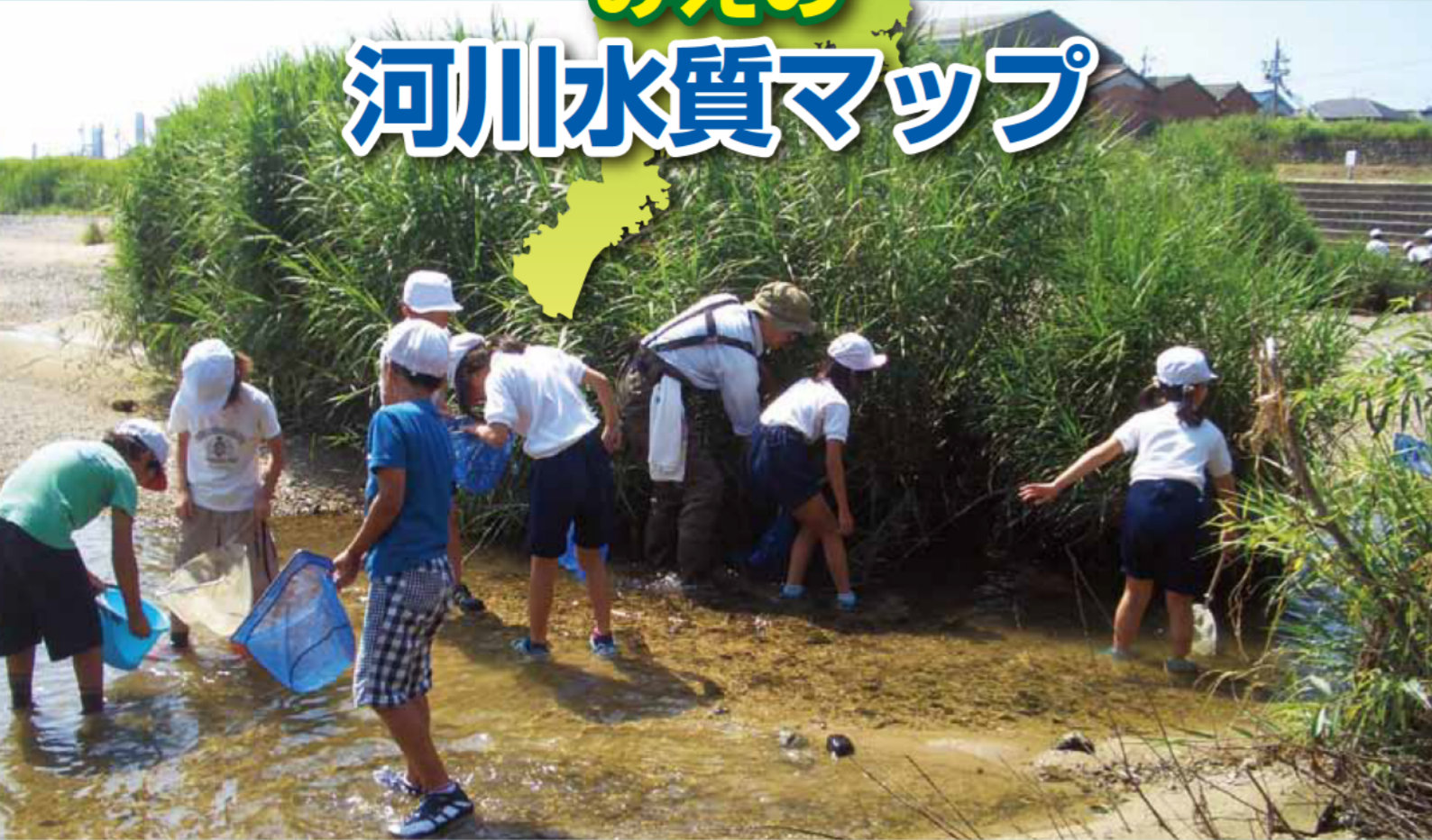
四日市市立橋北小学校