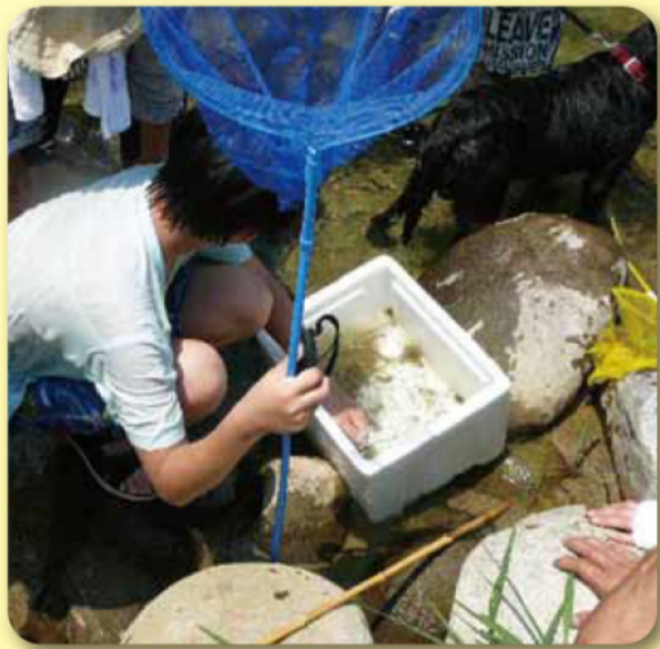
しぜん・ふしぎ・ワンダーランド