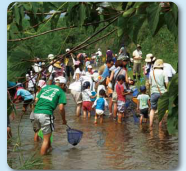
四日市市環境学習センター