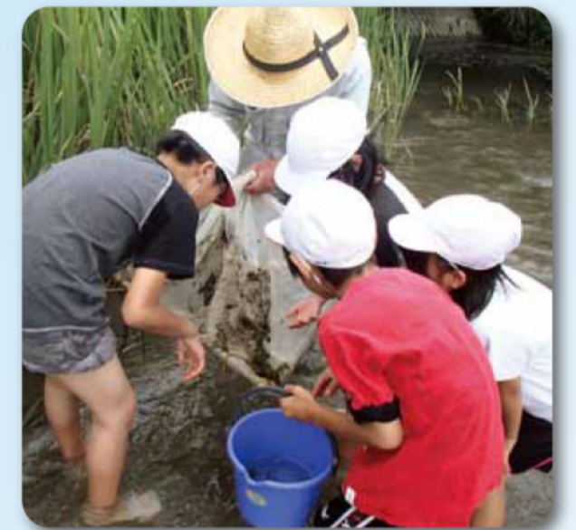
むらおこし・かみみいと(上御糸小学校)