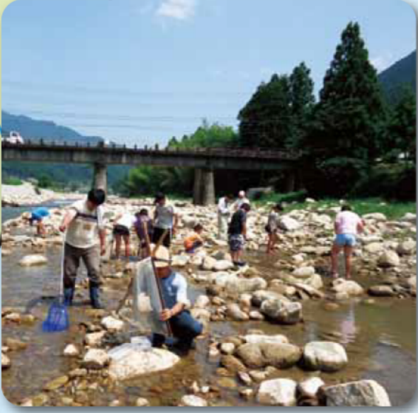
熊野市立五郷小学校