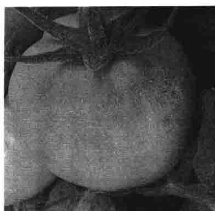
果実のコルク状化・褐変