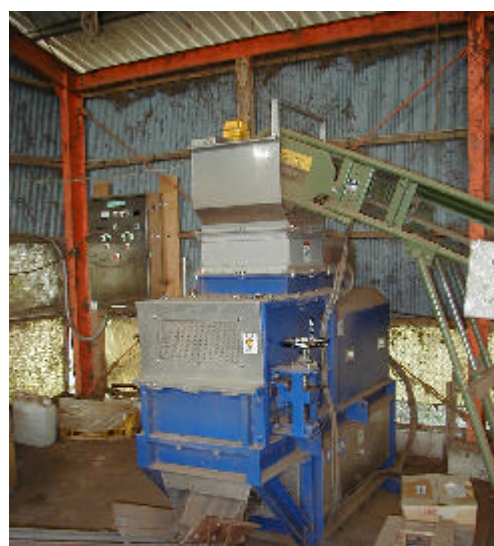
試験中の成型機本体(ディスクペレッター)