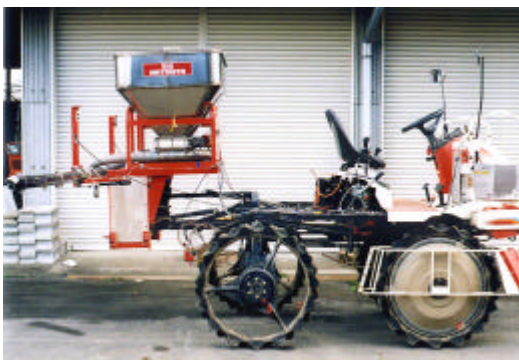
鶏ふんペレット散布機