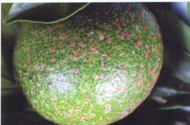
写真：アカマルカイガラムシ果実寄生の様子