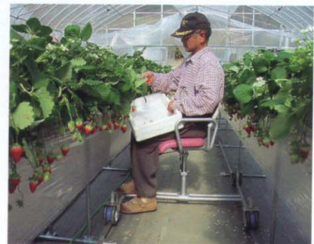
図2 バリアフリーイチゴ高設栽培