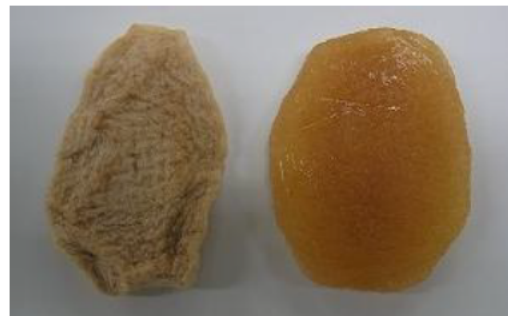
図2 梨のセミドライフルーツ