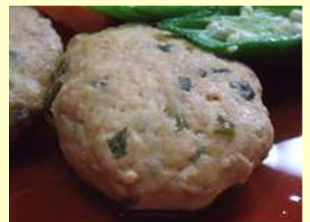
手作りひりょうす