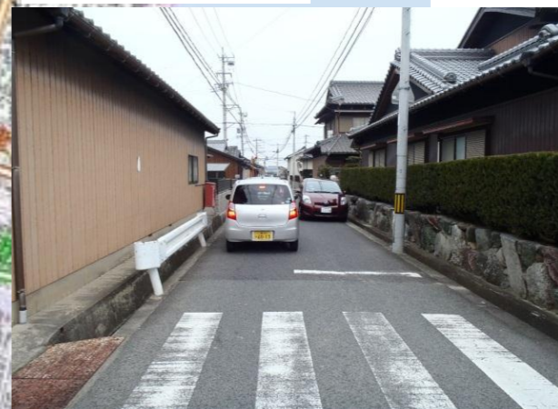
②整備後 雲出野田バイパス