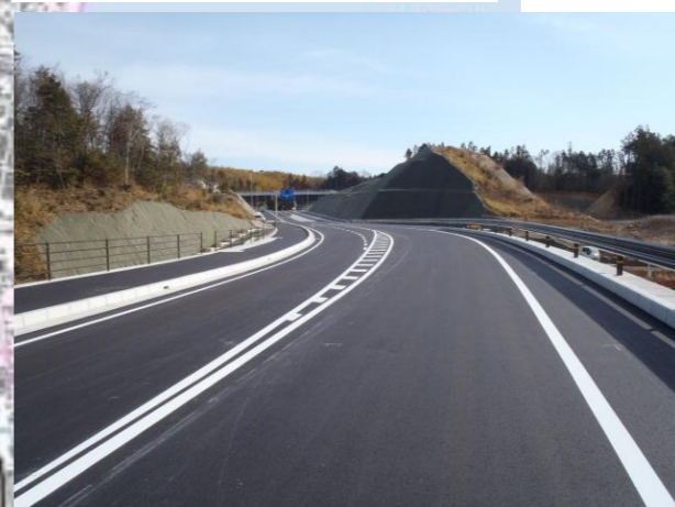
③整備後 五軒町バイパス