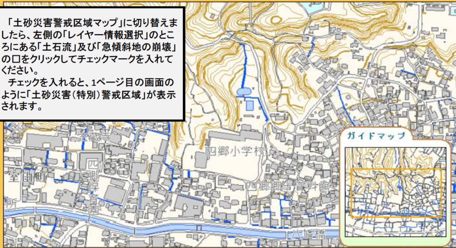
▶ガイドマップを表示

チェックを入れると、1ページ目の画面のように「土砂災害(特別)警戒区域」が表示されます。