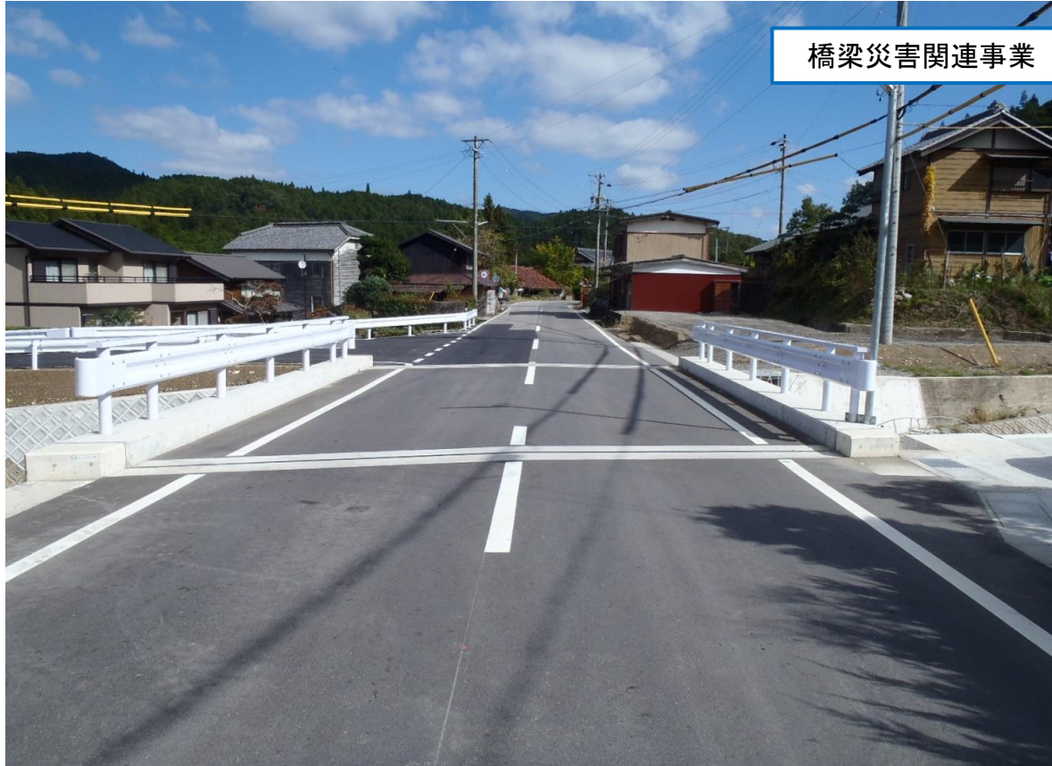
橋梁災害関連事業