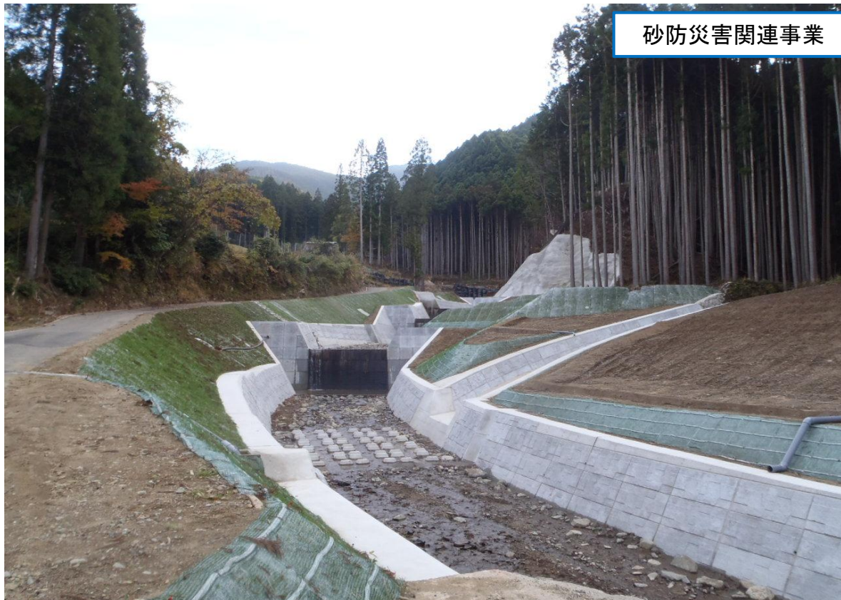
砂防災害関連事業